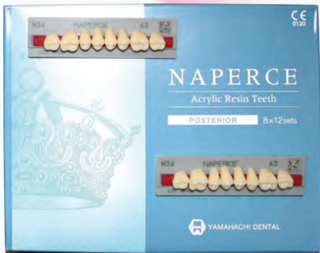
Набір жувальних зубів Naperce, 8 шт