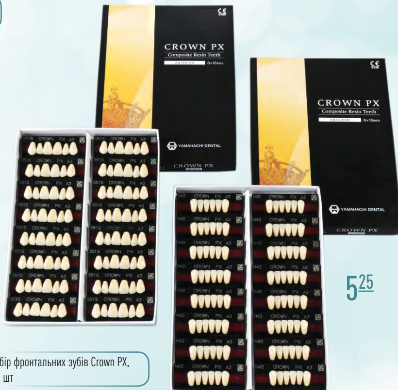
Набір фронтальних зубів Crown PX, 6 шт