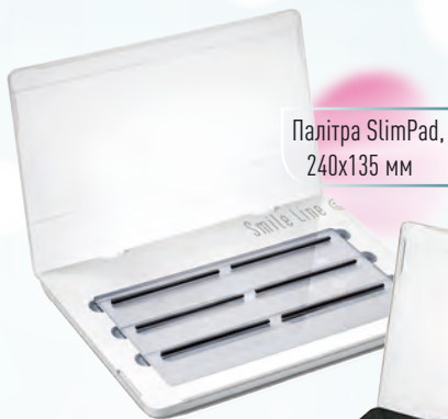
Палітра SlimPad, 240x135 мм

Барвник для кераміки United Colors of D.Vinci