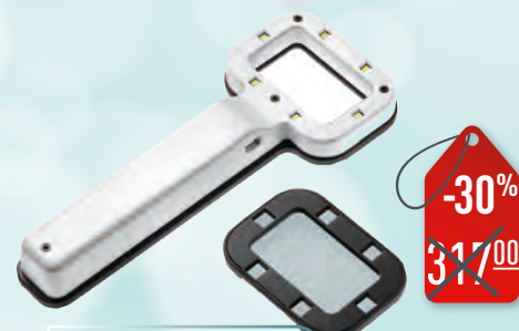
Комплект для визначення кольору