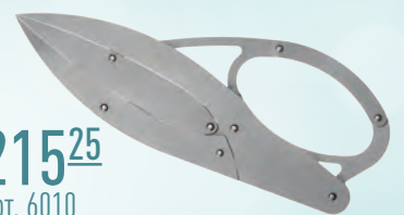
Divider The Golden Section