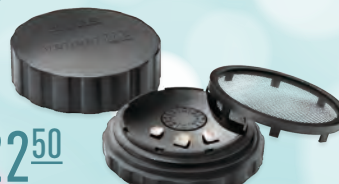
Контейнер для вінірів VeneerME