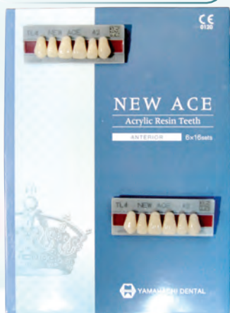
Набір фронтальних зубів New Ace, 6 шт