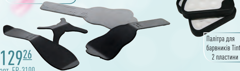
Палітра для барвників Tinto, 2 пластини