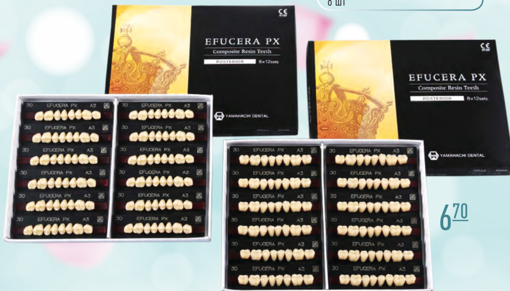
Набір жувальних зубів Efuscera PX, 8 шт